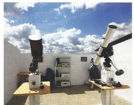
Die Volkssternwarte in Meckesheim

vor Christus nieder, später kamen auch die Römer. Die am weitesten in die Vergangenheit reichende Sehenswürdigkeit der Gemeinde ist die St. Martinskapelle, die noch als Ruine vorhanden ist (siehe Infoleiste). ■